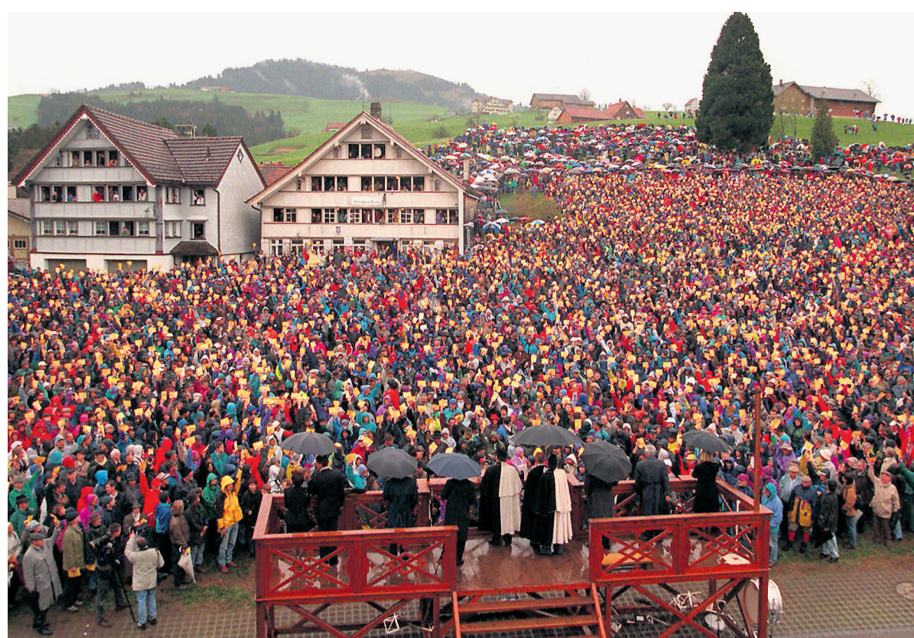
Die Ausserrhoder Bevölkerung kam am 27. April 1997 in Hundwil zur bisher letzten Landsgemeinde zusammen.

Seither fallen die Stimmbürger ihre kantonalen politischen Entscheide im stillen Kämmerlein – wie beinahe überall im Land, abgesehen von Glarus und Appenzell Innerrhoden. Gemäss Initiativkomitee hatte dies für Ausserrhoden negative Folgen. «Die Anonymität der Urnenwahl verhindert den Zusammenhalt des Volks», hält es bedauernd fest. Dem Kanton fehle nicht nur sein wichtigster politischer und kultureller Anlass, der ihm nach innen und aussen Charakter verliehen habe. Er habe auch