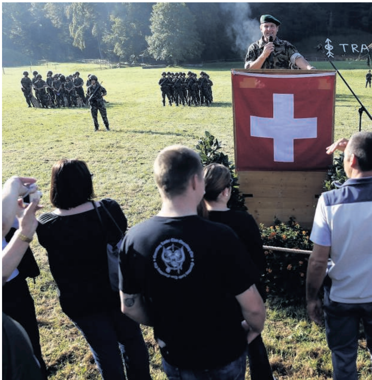
Bezoekdag bij een Zwitserse legerbasis. Een voorstel om de dienstplicht af te schaffen is afgelopen september