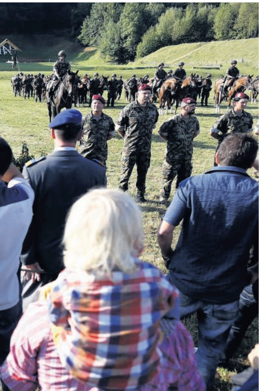
weggestemd door de Zwitsers.